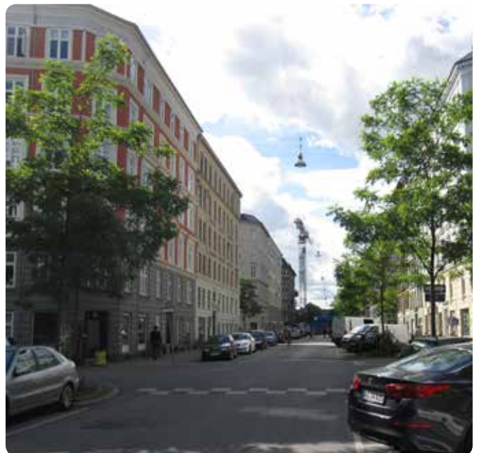
Ovenfor ses to billeder af den samme gade – uden gadetræer og med gadetræer.