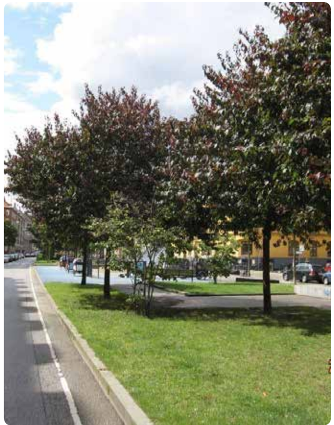
I forbindelse med renoveringen af Sønder Boulevard blev der plads til/bevaret træer, som er med til at skabe læ og skygge. Træerne er med til at skabe et trygt rum til ophold væk fra vejen