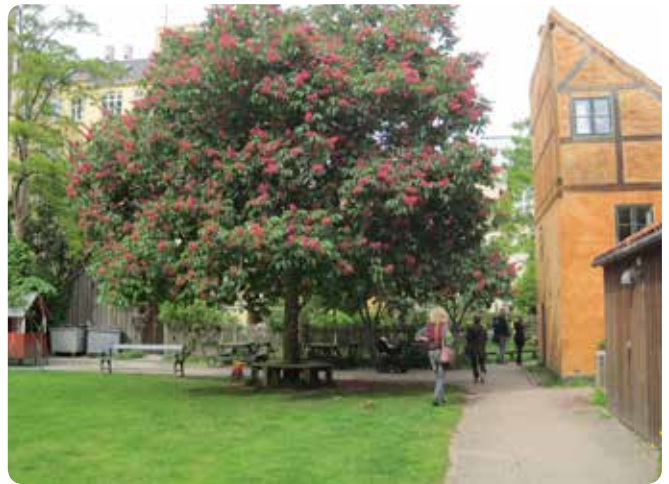
I mange af Københavns fælles gårdhaver gror der store træer, der giver gårdrummene en hel særlig karakter og identitet, som det ses her i en gårdhave på Christianshavn.