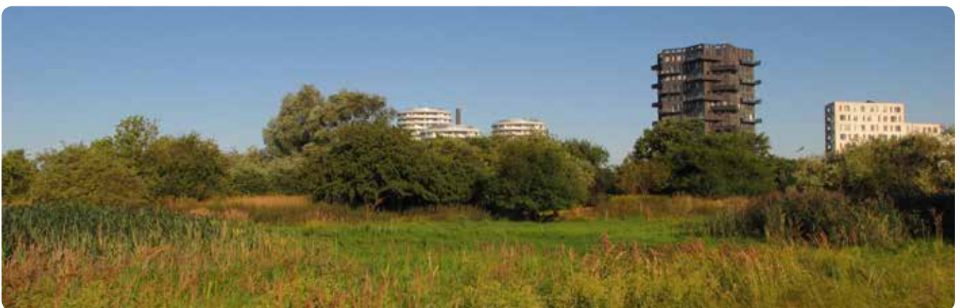
Træer i naturområder er ofte hjemmehørende arter. De er derfor vigtige bidragsydere i forhold til at øge den biologiske mangfoldighed, da de hjemmehørende arter er hjemsted for mange insekter og svampe.