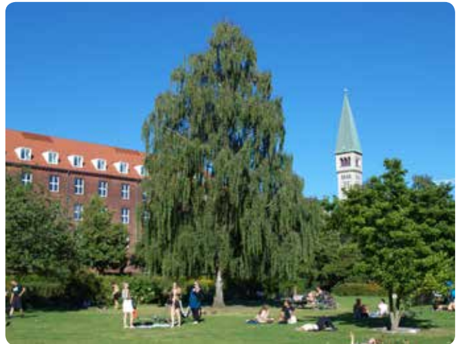
I byens parker er der plads til, at de store flotte solitære træer kan 'folde sig ud'. Parktræerne er med til at danne rammer for parkens rekreative funktioner, som det ses her i Enghaveparken.