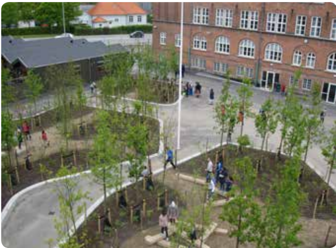
Amager Fælled Skole har fået landets første skovskolegård. Træerne er med til at danne ramme om spændende leg- og læringsmiljøer.