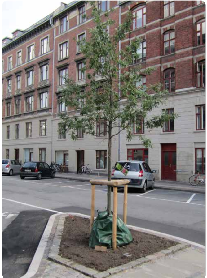
Eksempel på udnyttelse af byens rum til plantning af et nyt træ i et boligkvarter.