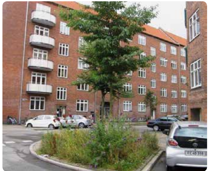
Gadetræ med underbeplantning.