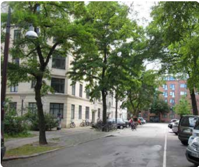
Gadetræer langs Tøndergade på Vesterbro.