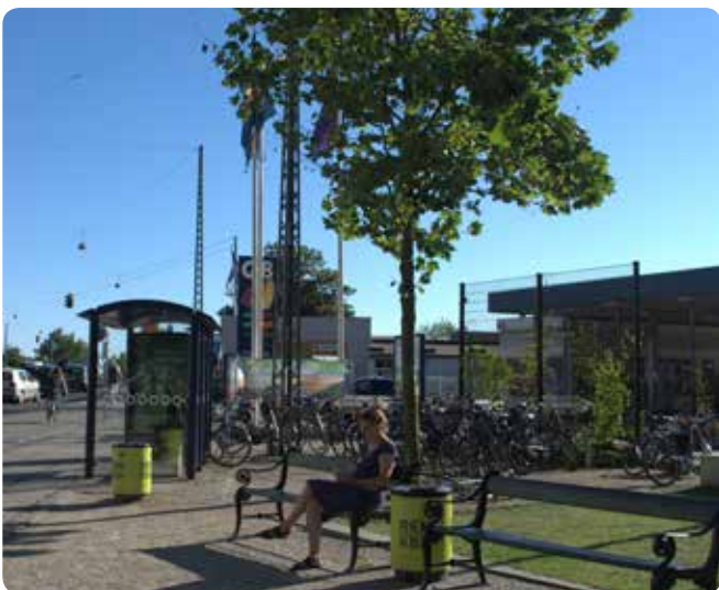
Træ der indgår i sammenhæng med de andre funktioner i byens rum.