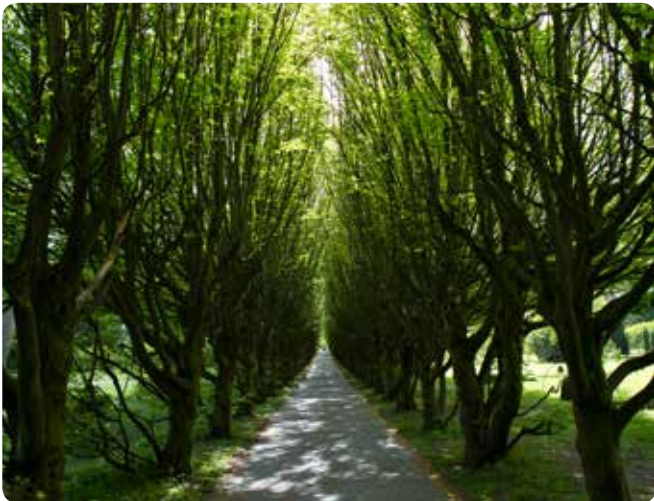
Træer er med til at skabe kulturhistorisk værdi og giver samtidig også naturoplevelser, som her på Vestre Kirkegård.