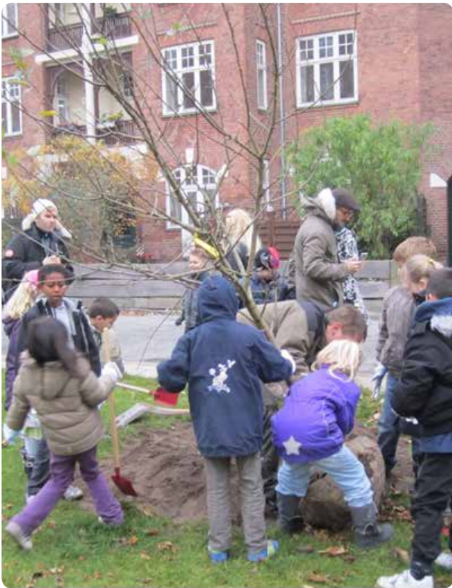
Skolebørn planter 'deres træ' i samarbejde med en gartner fra Teknik- og Miljøforvaltningen.