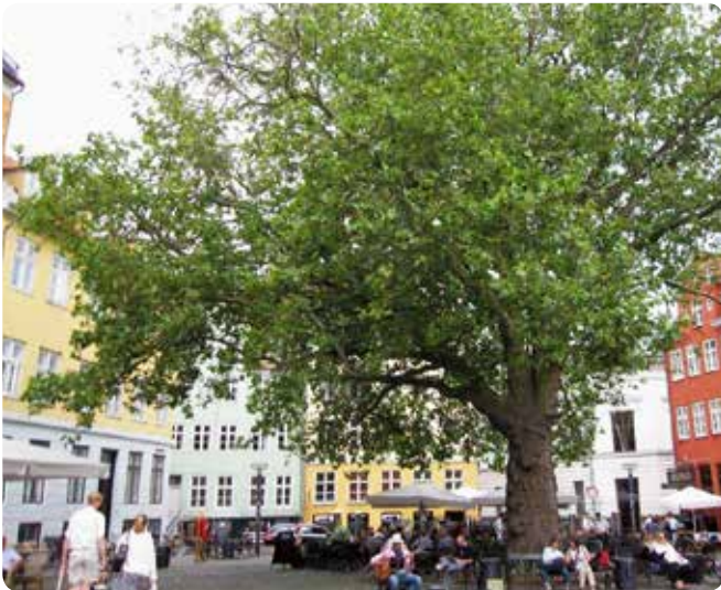
På Gråbrødretov står et gammelt Platantræ, der er identitets- skabende for torvet.