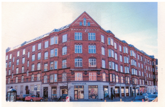
AB Kap Arkona